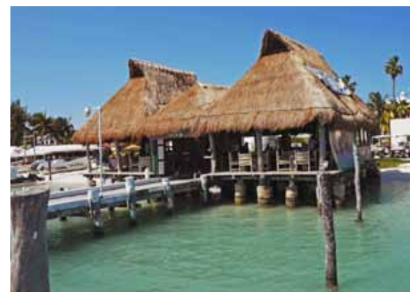
Bij een restaurantje aan het strand genieten we van een vers klaargemaakte maaltijd.

geweest. De sardines worden gewoon voor de lange neuzen van de zeilvissen weggekaapt door de jagende dorado's. Na enkele minuten is het feestmaal voorbij en de school sardientjes is geheel verdwenen. Alleen de vele schubben herinneren nog aan het fascinerende schouwspel. Terwijl de zeilvissen uit het zicht verdwijnen en we op de boot wachten die ons oppikt, komen we midden in een groep dolfinen terecht die nieuwsgierig om ons heen zwemmen. Terug aan boord is het voor ons weer afwachten geblazen voor hopelijk een nieuwe thrill waarbij alles van voren af aan begint.