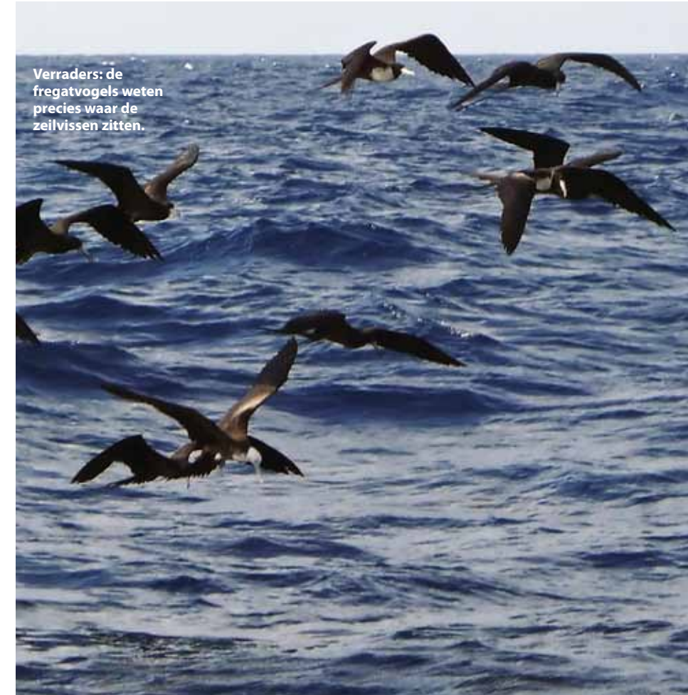
Verraders: de fregatvogels weten precies waar de zeilvissen zitten.