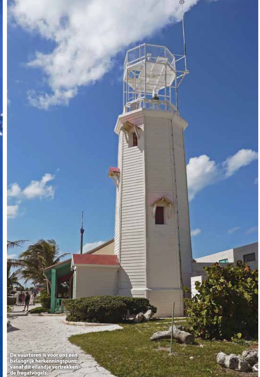
De vuurtoren is voor ons een belangrijk herkenningspunt: vanaf dit eilandje vertrekken de fregatvogels.

D e fregatvogels verraden waar de zeilvissen zijn. Met hun enorme vleugels cirkelen ze opgewonden boven het water. Ze hebben een groep sardines gevonden. Maar zij zijn niet de enige die de school ontdekt hebben. Hoge vinnen van zeilvissen steken boven het water uit. En die zijn druk onder water. Ze drijven de sardines bijeen tot een kleine bal en vallen dan om de beurt aan. De arme visjes hebben geen schijn van kans. Onze boot nadert voorzichtig, in de hoop dat de school naar ons toe komt. Sardines gaan vaak richting het licht om de zeilvissen te verblinden, dus de kapitein legt de boot aan de kant van de zon. De zeilvissen sturen de sardines echter alle kanten op. We krijgen het