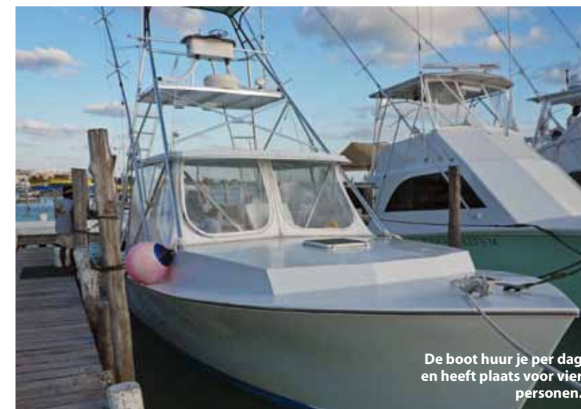
De boot huur je per dag en heeft plaats voor vier personen.

klappen, lijken de zeilvissen nog groter en bedreigender voor hun prooi die steeds meer bijeengedreven wordt. Als ze willen, kunnen de zeilvissen van kleur veranderen, van een blauwgroene gloed bij het jagen tot zilver of zwart als ze aan het eten zijn. De school sardines en de jagende zeilvissen schieten ons voorbij. Voordat ik het weet verdwijnen ze in het blauw. Uitgeput komen we boven: vanochtend om 07:00 klaar staan was vroeg, maar het was het meer dan waard. Ons vaartuig is een 11 meter lange vissersboot met een verhoogde cabine (tonijnbrug) voor de kapitein. Daarnaast heeft de boot GPS met visherkenning. Er is plaats voor vier snorkelaars en je kunt de boot per dag huren om te snorkelen. De bemanning aan boord